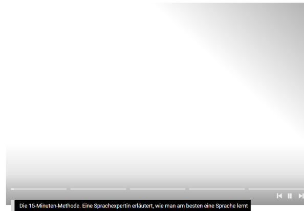
Die 15-Minuten-Methode. Eine Sprachexpertin erläutert, wie man am besten eine Sprache lernt