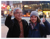
Zwei weitgeristen Touristen aus Japan gefallen die unkonventionellen Leuchtdesigner.